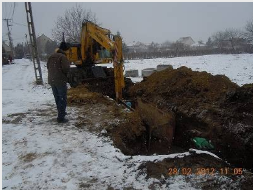
Donát utca 3-8-0