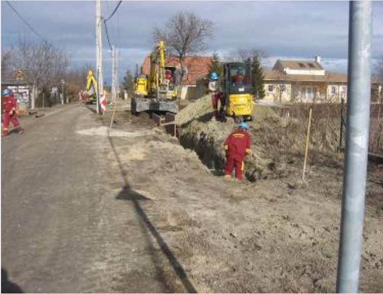
Feketehegy, Körösi utca F-3-0