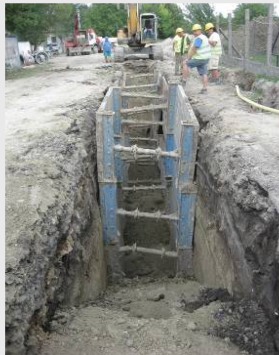
Takarodó utca 3-0-0