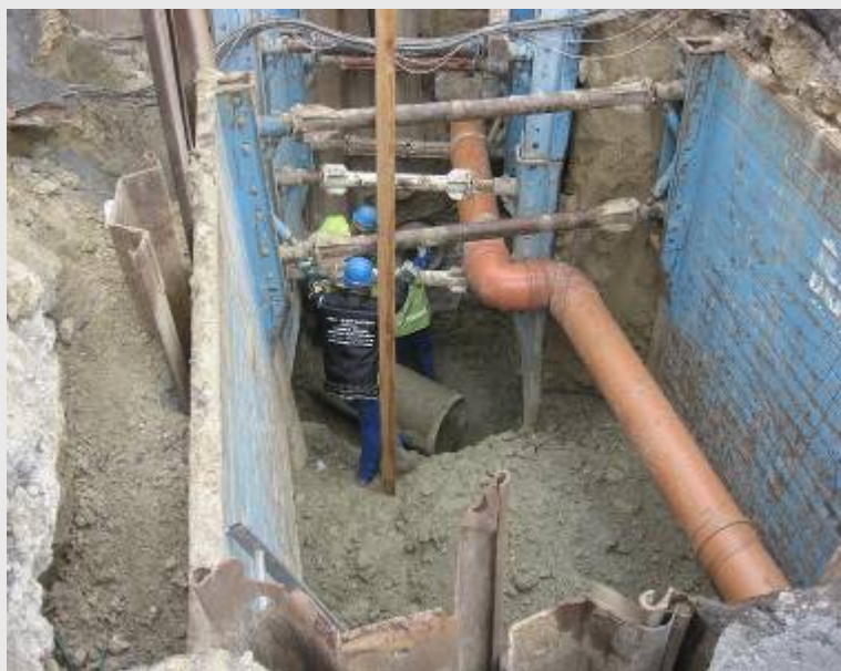
Mártírok utca 7-0-0