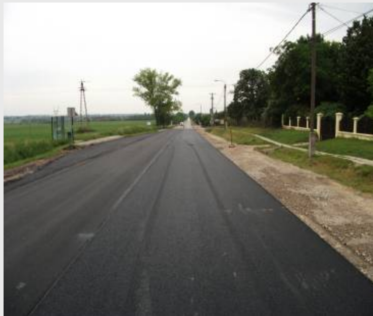
Szőlőhegy, 62. sz. főút