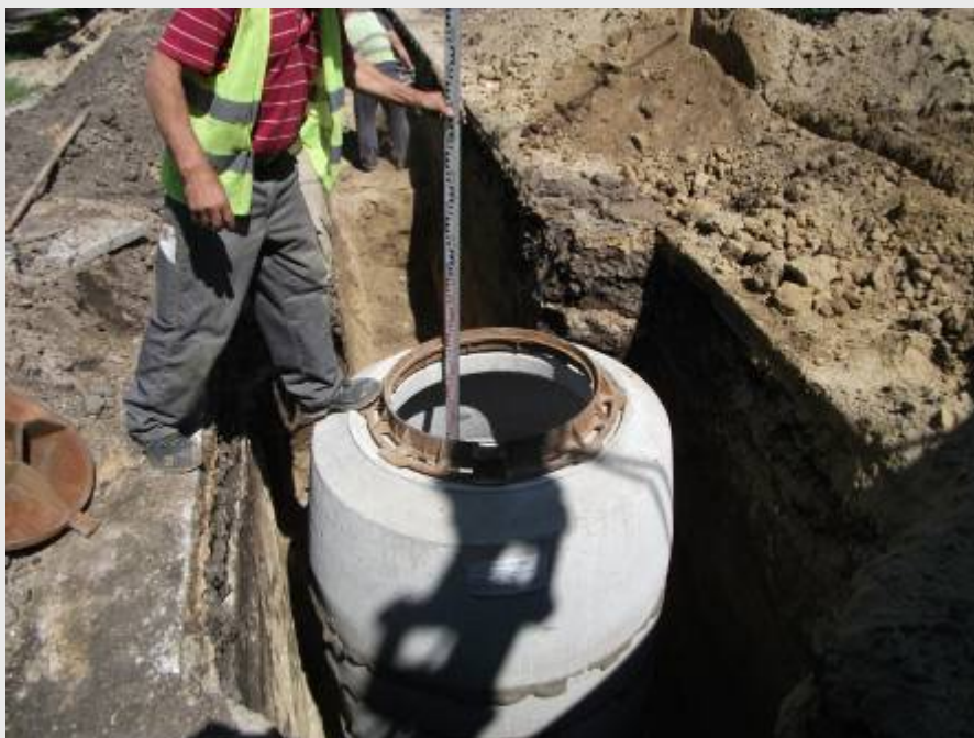
B-2-0 csatornaszakasz, Köztársaság utca