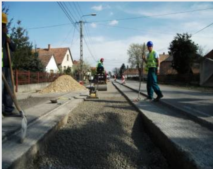
Seregélyes, 62. sz. főút