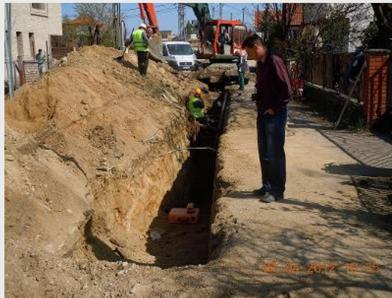
Öreghegy, Kriványi utca 3-61-17