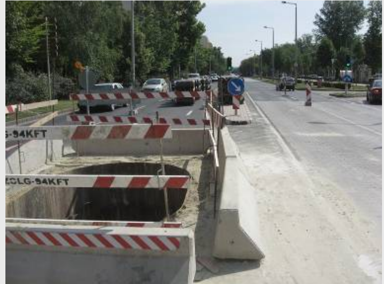
Budai út 8-0-0