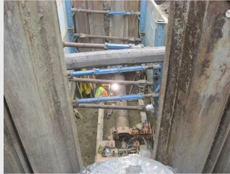
Fiskális utca 7-0-0 sajtolás