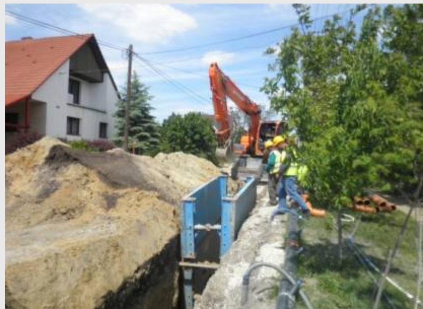
Kölcsey utca, P 2-5-0 Gerinc fektetés