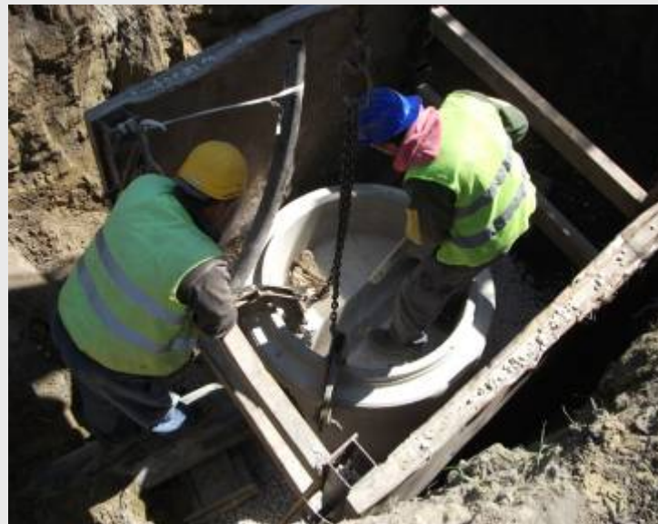
Seregélyes, Fő utca