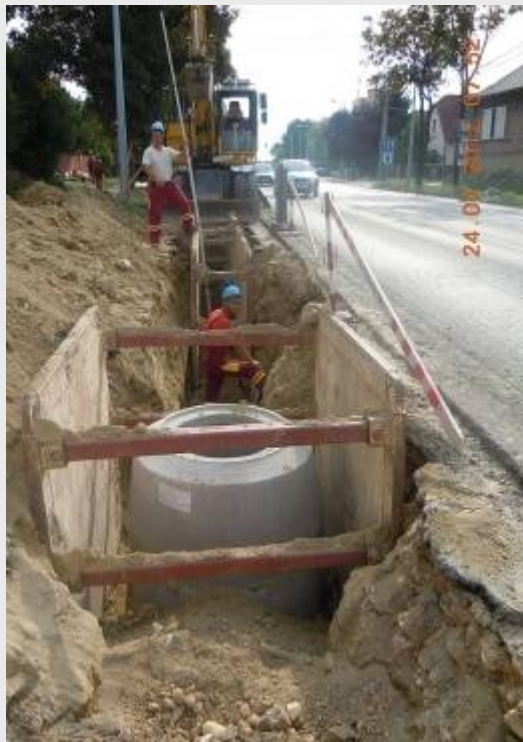
Budai utca 3-62-0