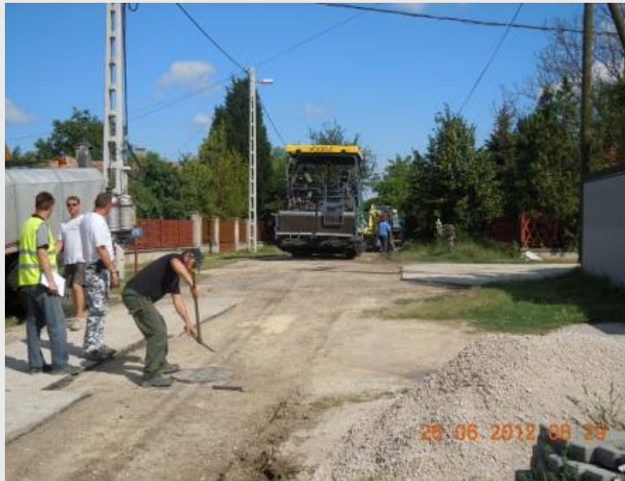
III-0-0 Gárdonyi utca 2.