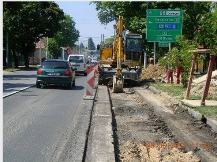
Budai utca 3-62-0