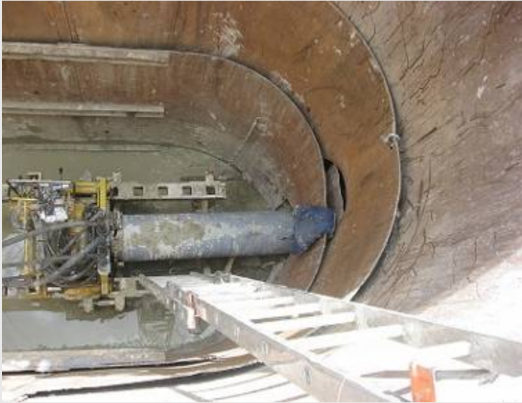
Budai út 8-0-0 sajtolás