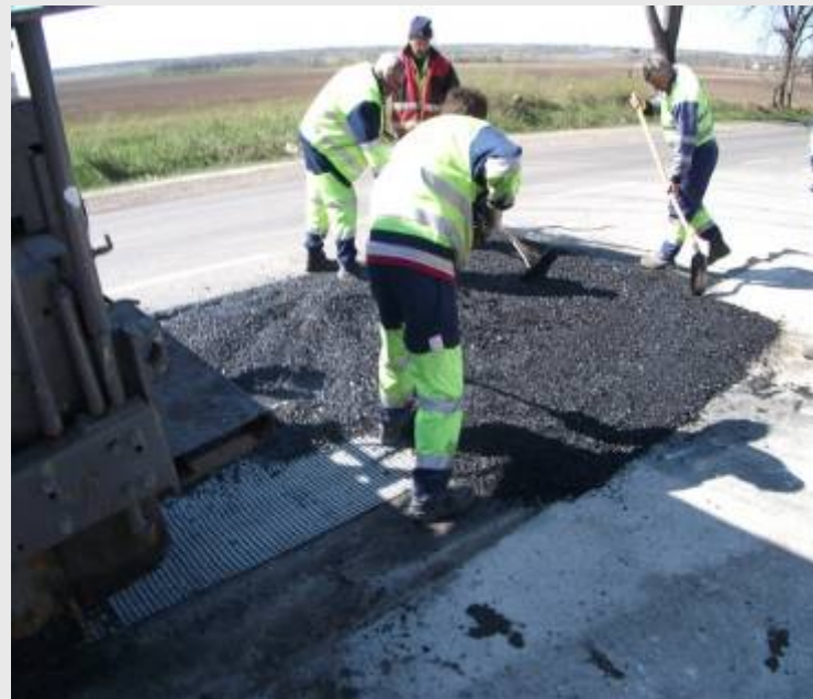
Szőlőhegy, 62. sz. főút